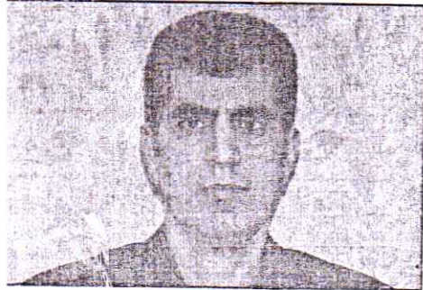
با تامین بیست هزار تن (۲۰۰۰۰) انواع کودهای کشاورزی یارانه ای به استقبال کشت پائیزه در استان گیلان می رویم