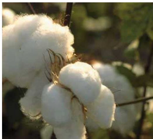
کارخانه دلینته کاشمر:

سوپرالیت، الیت و گواهی شده می باشد که این بذور تولیدی عمدتاً از سطح ۶۰۰۰ هکتار از اراضی پنبه مورد پیمان در سطح استان واقع در شهرستانهای کاشمر، خلیل آباد، بردسکن، تربت جام، تایباد، سرخس، نیشابور و تربت حیدریه بوده که با انجام عملیات تصفیه در ۸ کارخانه تصفیه پنبه از کارخانجات استان استحصال می گردد. با توجه به اینکه طی سنوات گذشته مصرف و کاشت بذور پنبه دلینته شده در سطح استان خراسان رضوی و کشور بعلت سهولت در کاشت و عملکرد بالا با استقبال بسیار چشمگیری توسط کشاورزان پنبه کار مواجه گردیده است، مدیریت شرکت در استان ضمن تعامل با اداره کل پنبه و دانه های روغنی، هر سال نسبت به دلینته کردن و کرک زدایی بخشی از بذور تولیدی، در کارخانه دلینته واقع در شهرستان کاشمر حسب نیاز اقدام می نماید.